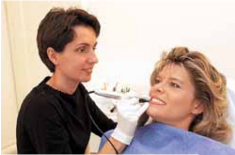
Retrouvez votre beauté naturelle!